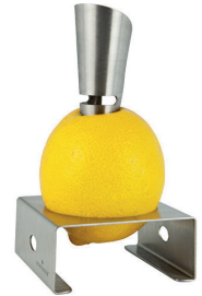
Elegante Zitronenpresse aus gebürstetem Edelstahl