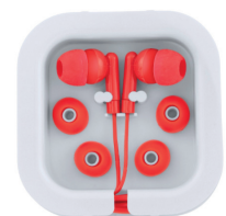
In-Ear-Kopfhörer, inklusive 3 Ohrstöpsel

Einfach und schnell geht's per Fax - Nr.: 069 - 586 0739 31