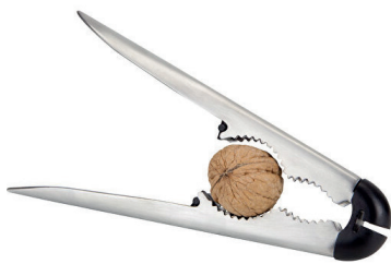
Gradliniger, moderner Nussknacker